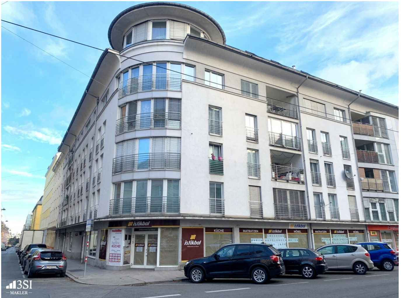
Renditeobjekt Rotenhofgasse Geschäftslokal