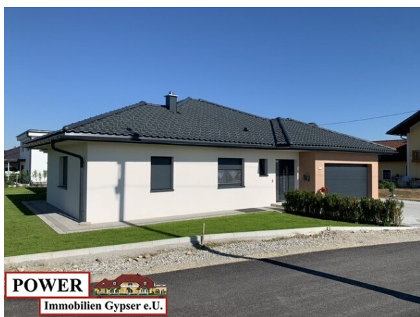
POWER Immobilien Gypser e.U.