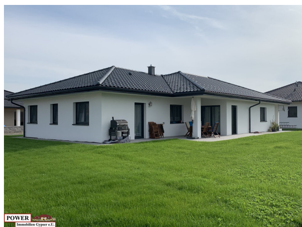
POWER Immobilien Gypser e.U.