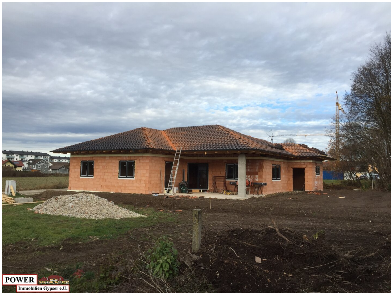
POWER Immobilien Gypser e.U.