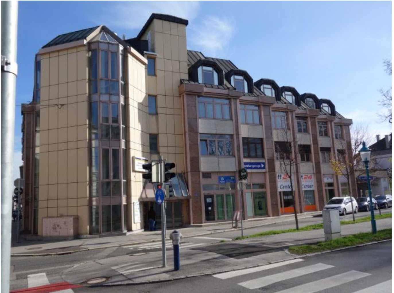
Ansicht 1 Original