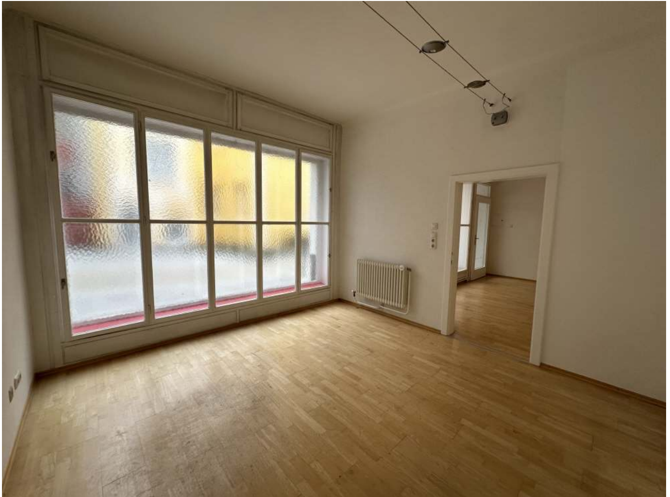
Raum 1 (1)