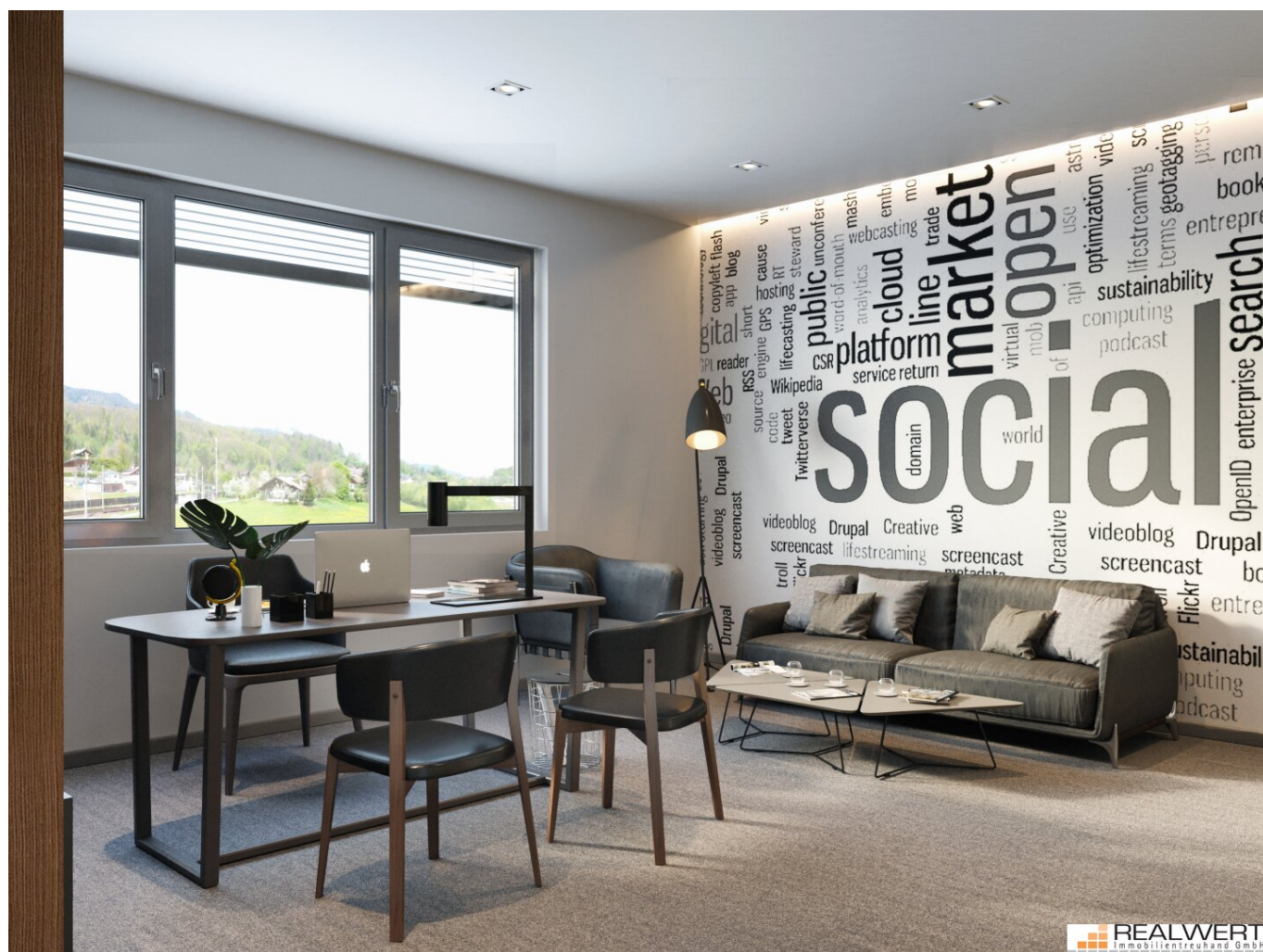
point PUCH - Beispiel Office 2

Objektnummer: 523/966 Eine Immobilie von Realwert