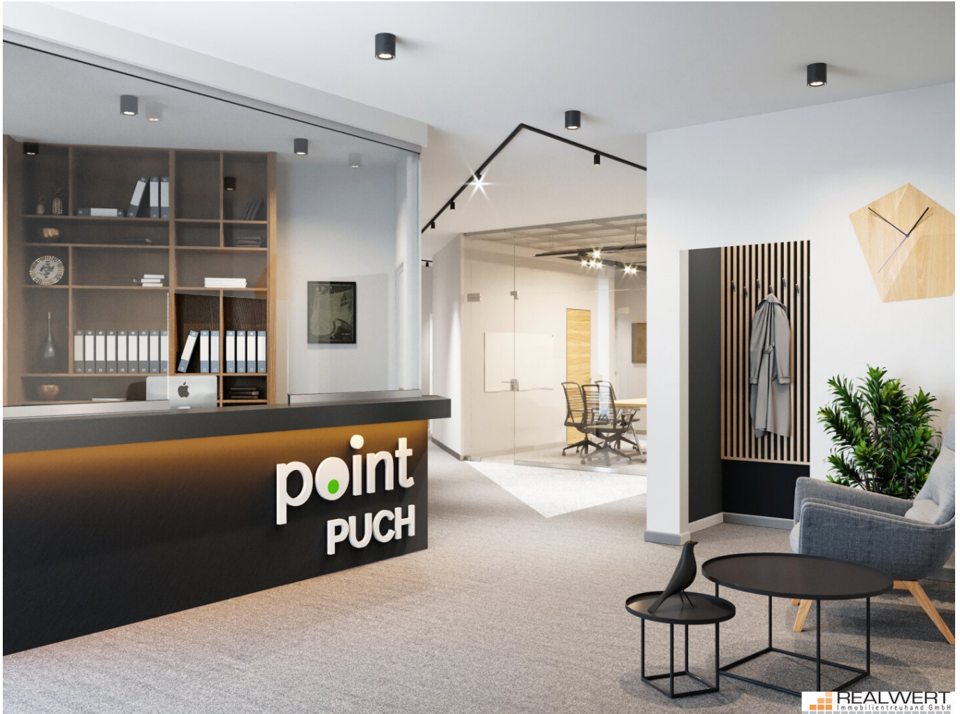
point PUCH - Beispiel Office - Ordination

Objektnummer: 523/970 Eine Immobilie von Realwert