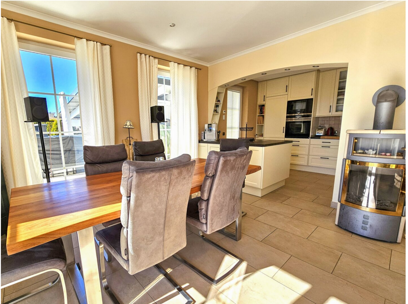
Blick über Essbereich in die moderne Tischler-Einbauküche