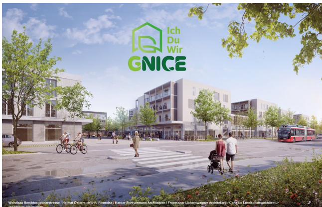
Wohnbau Berchtesgadnerstrasse / Heimat Österreich / Harder Spreyermann Architekten / Froscher Lichtwagner Architektur / Carla Lo Landschaftsarchitektur