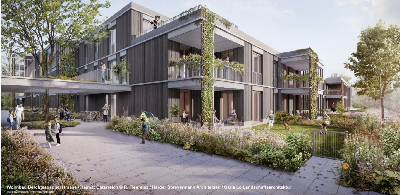
Wohnbau Berchtesgadnerstrasse / Heimat Österreich Harder Spreyermann Architekten / Carla Lo Landschaftsarchitektur