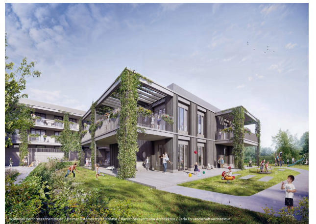
Wohnbau Berchtesgadnerstrasse / Heimat Österreich © R. Flenreiz / Harder Spreyermann Architekten / Carla Lo Landschaftsarchitektur