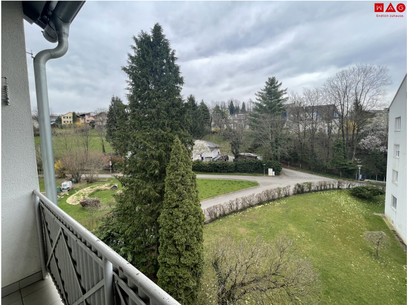
Aussicht Balkon Symbolfoto