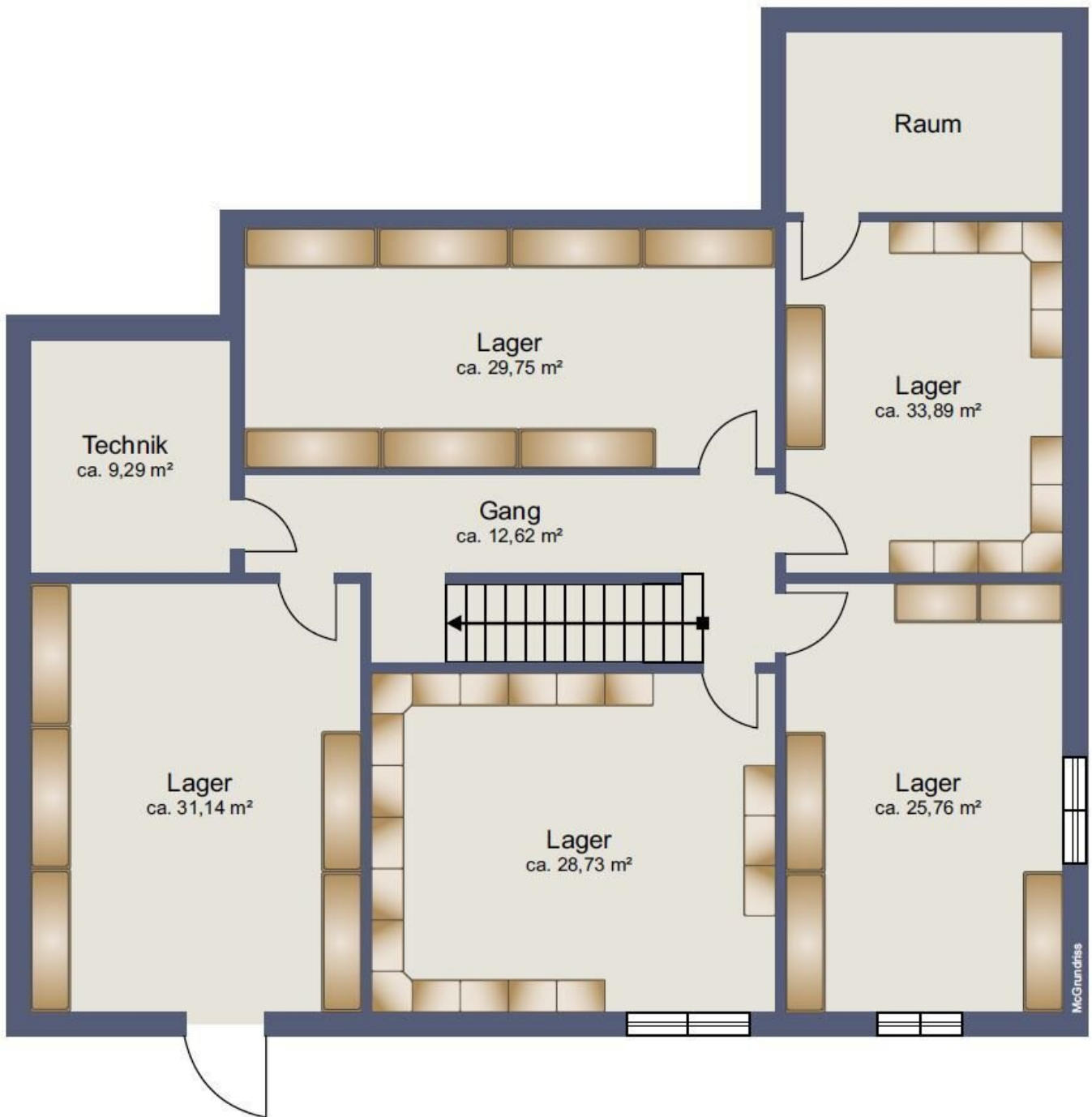
Planskizze Kellergeschoss ca. 171 m 2 Nutzfläche, unverbindlicher Einrichtungsvorschlag