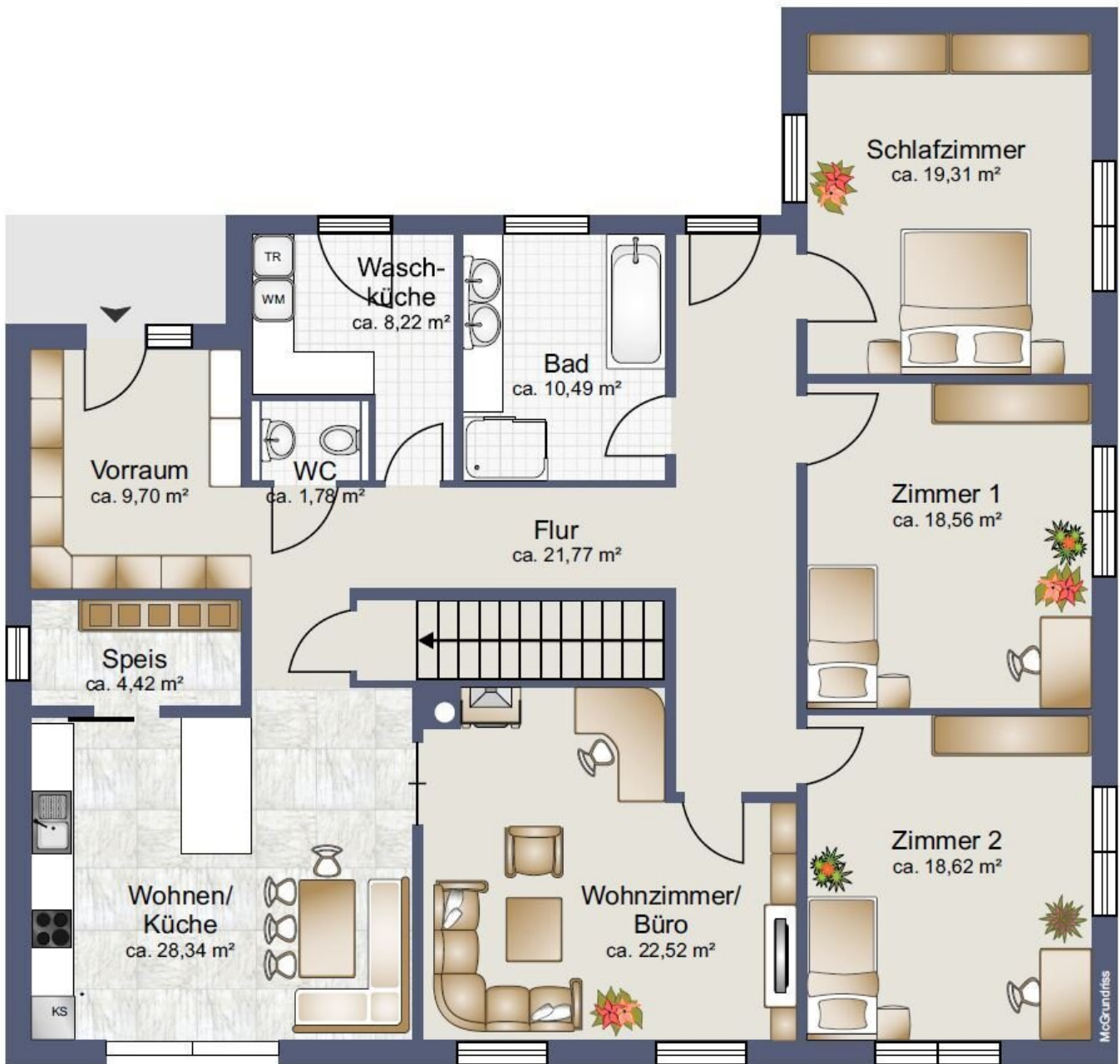
Planskizze Erdgeschoss ca. 163 m 2 Nutzfläche, unverbindlicher Einrichtungsvorschlag