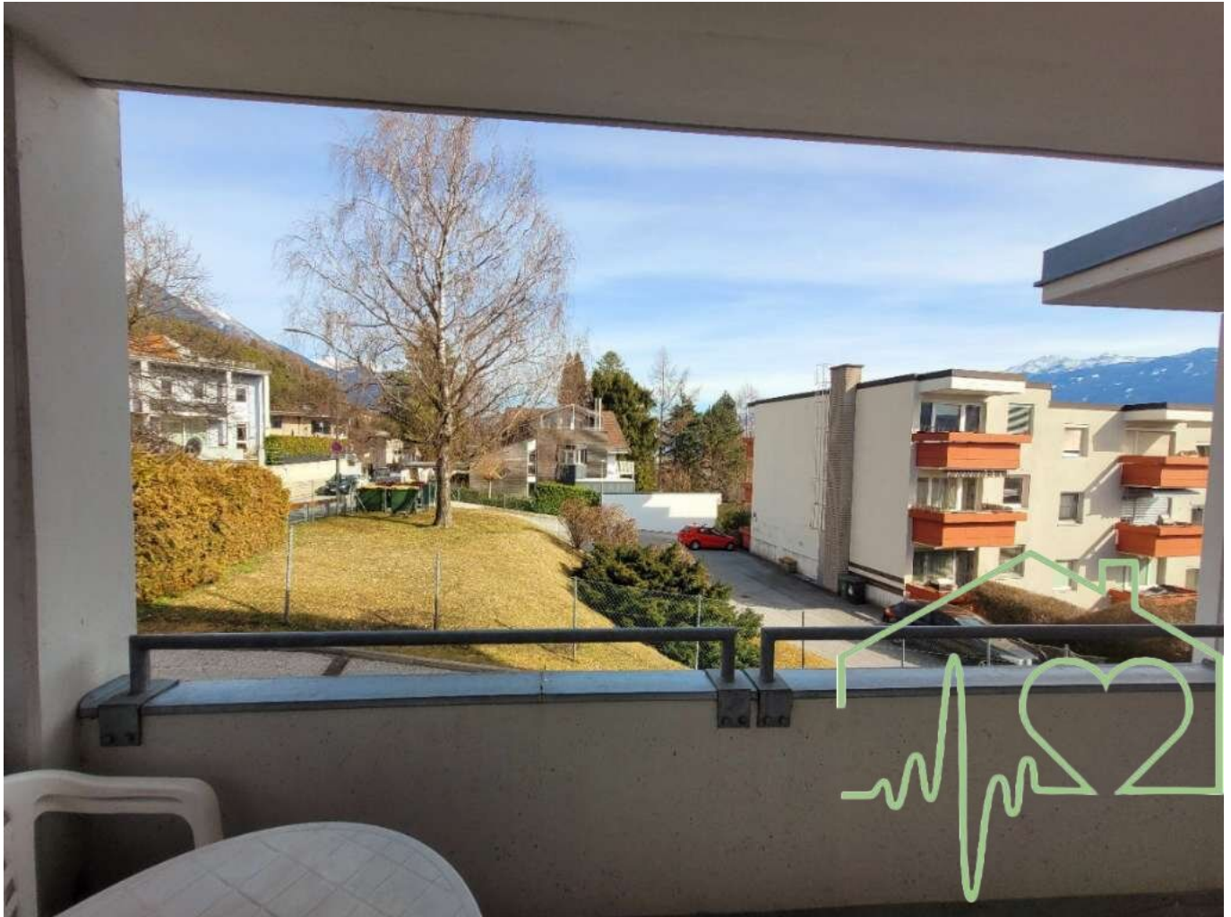
Aussicht vom Balkon