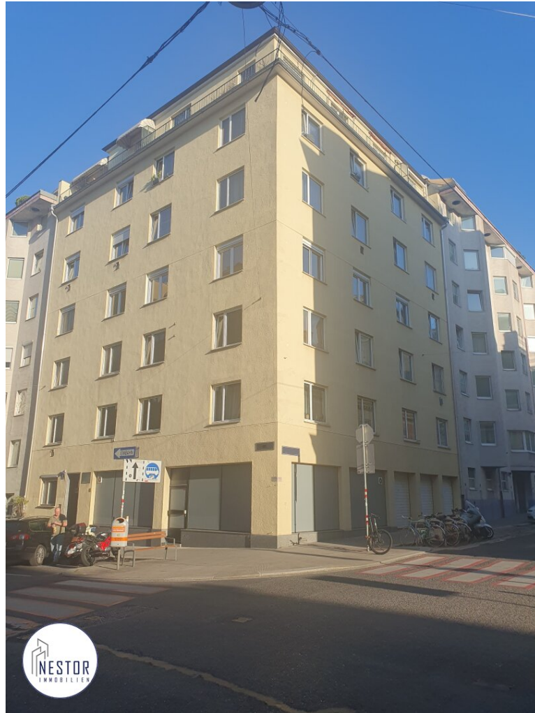
Wohnung - NESTOR Immobilien