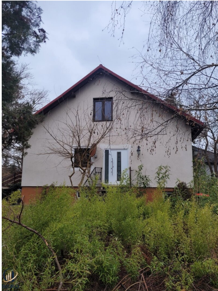
Parzelle 2, ca. 650 m 2 mit Einfamilienhaus