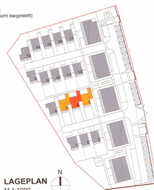
LAGEPLAN M 1:1000