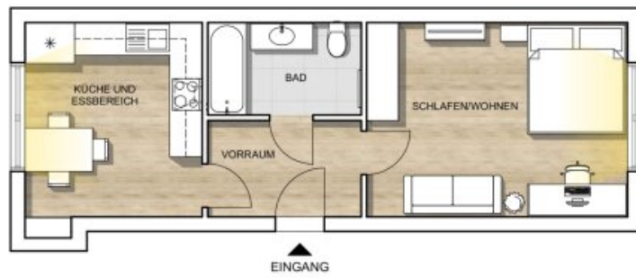
WOHNUNGSPLAN M 1:100