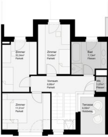
HAUS 3 - DACHGESCHOSS