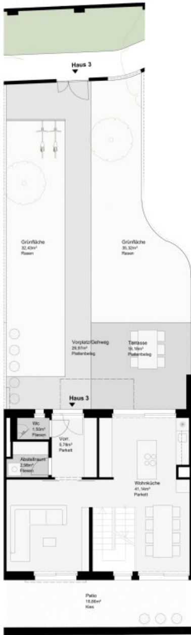
HAUS 3 - ERDGESCHOSS