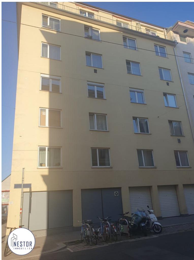
Wohnung - NESTOR Immobilien