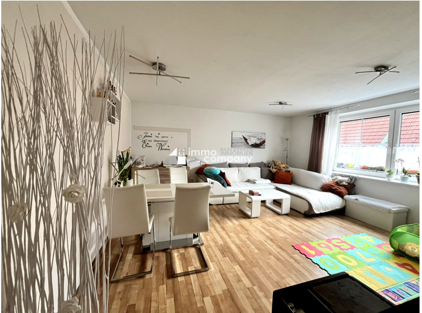
Wohnzimmer mit Essplatz - Einfamilienhaus Wöllersdorf