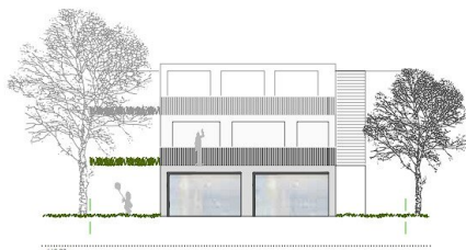
ansicht ost haus a