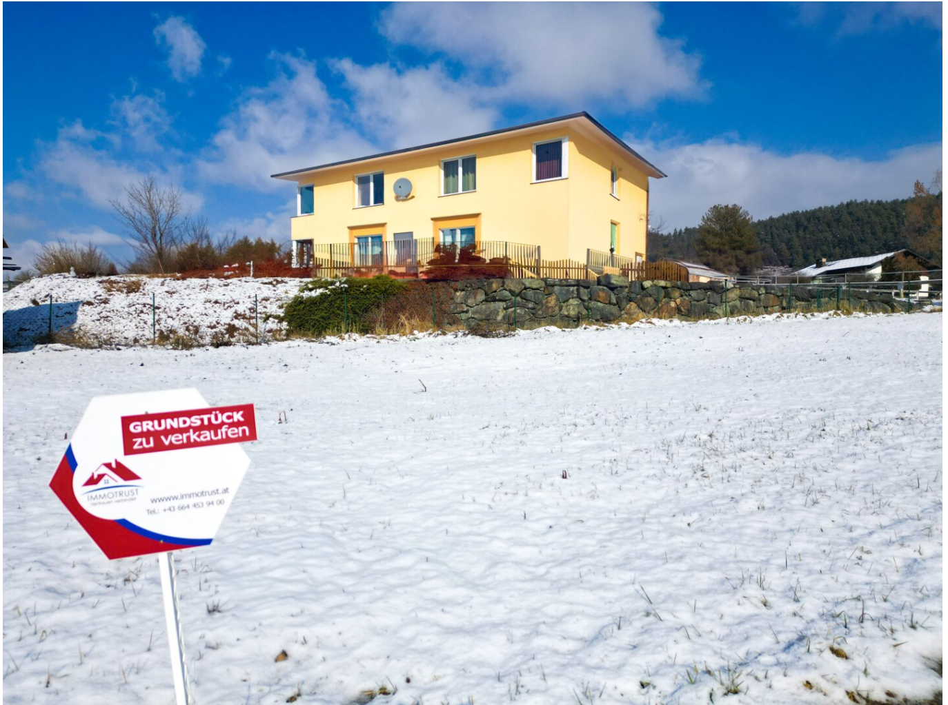
Bild vom Grundstück