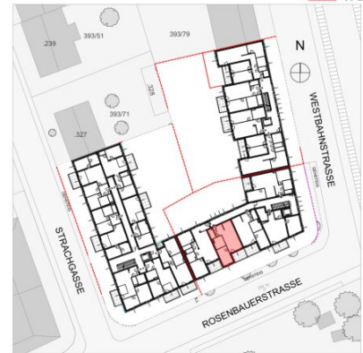
LAGEPLAN | M 1:500