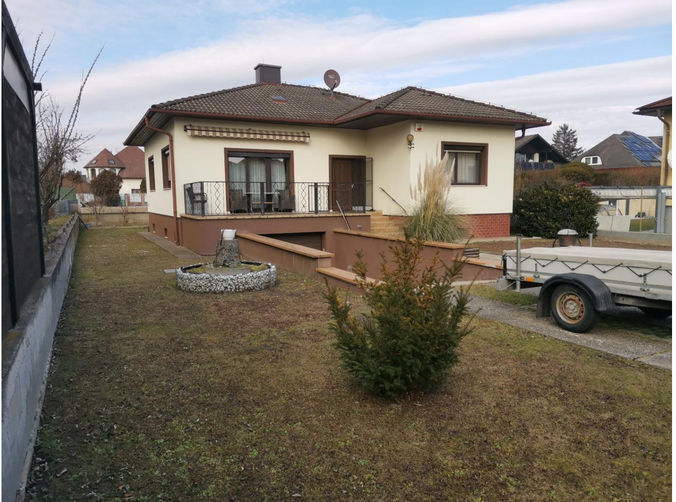
Bungalow in Oberhausen