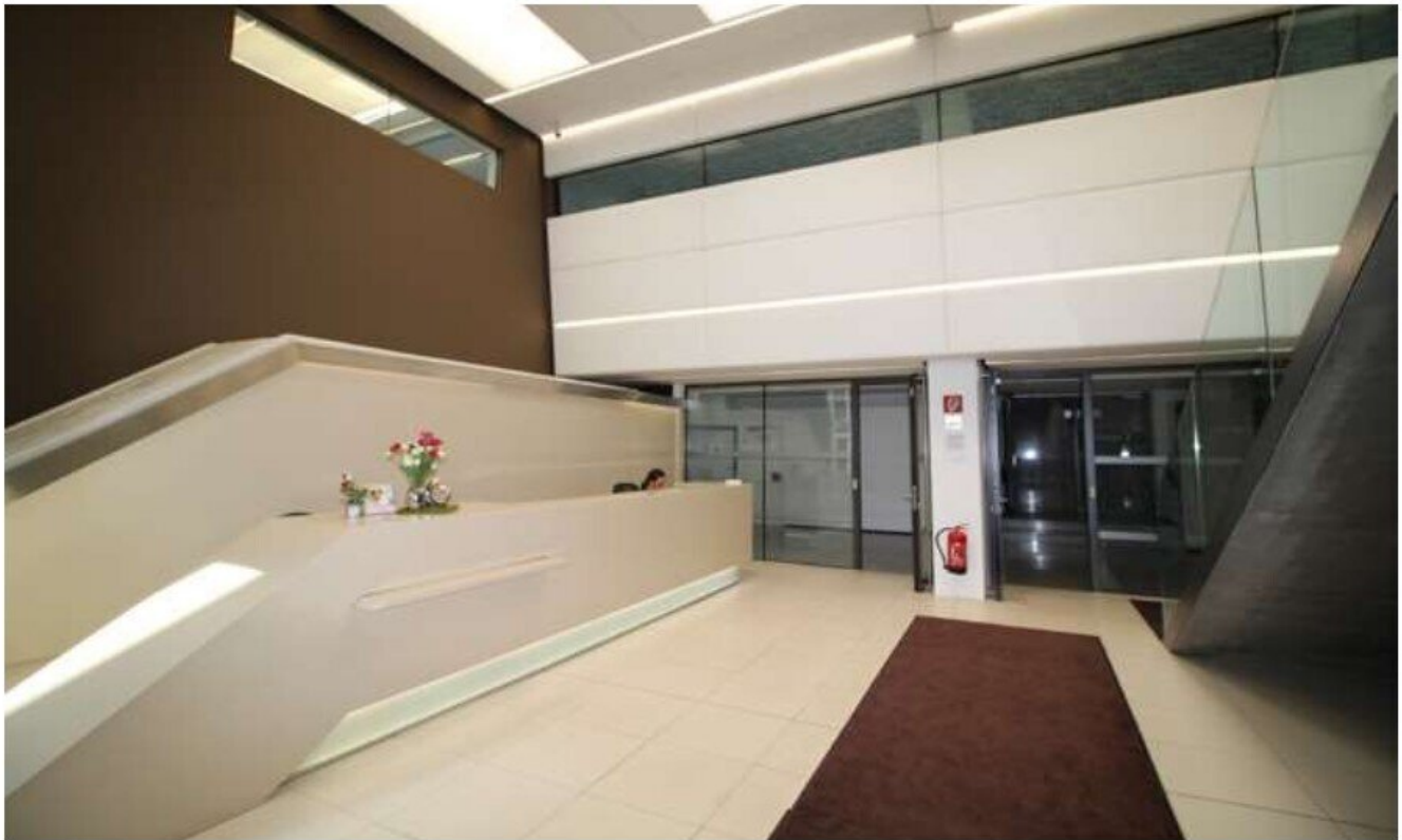
Main Entrance. Concierge Service Building