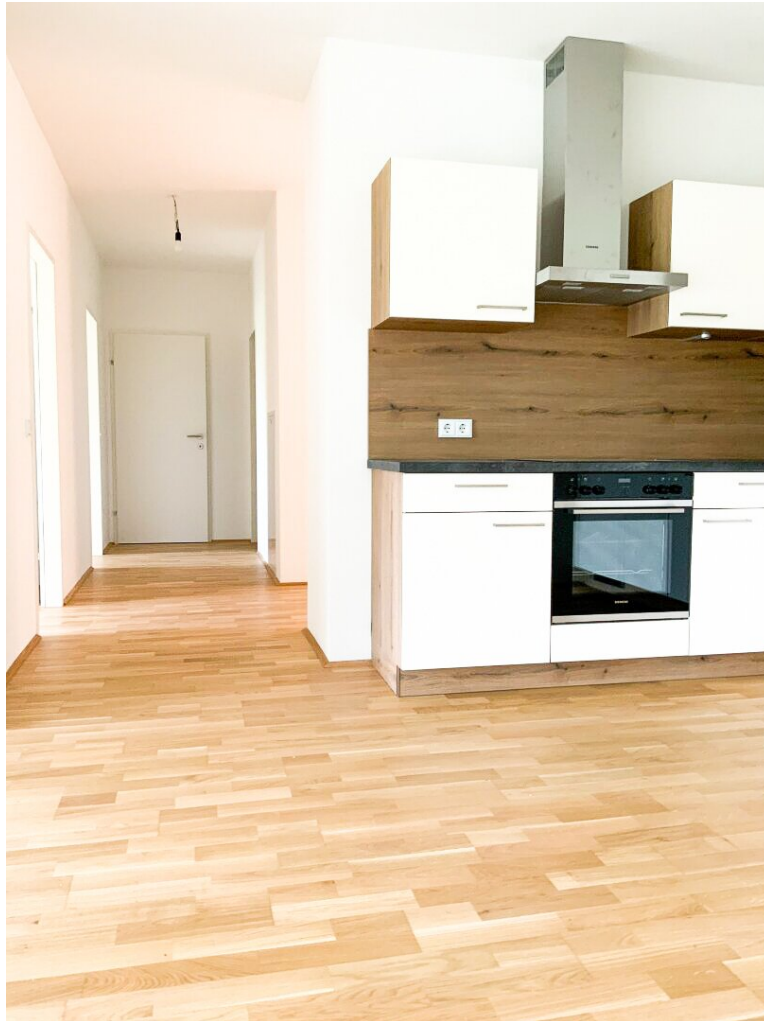
Teil der Küche mit Zugang zu den Schlafzimmern