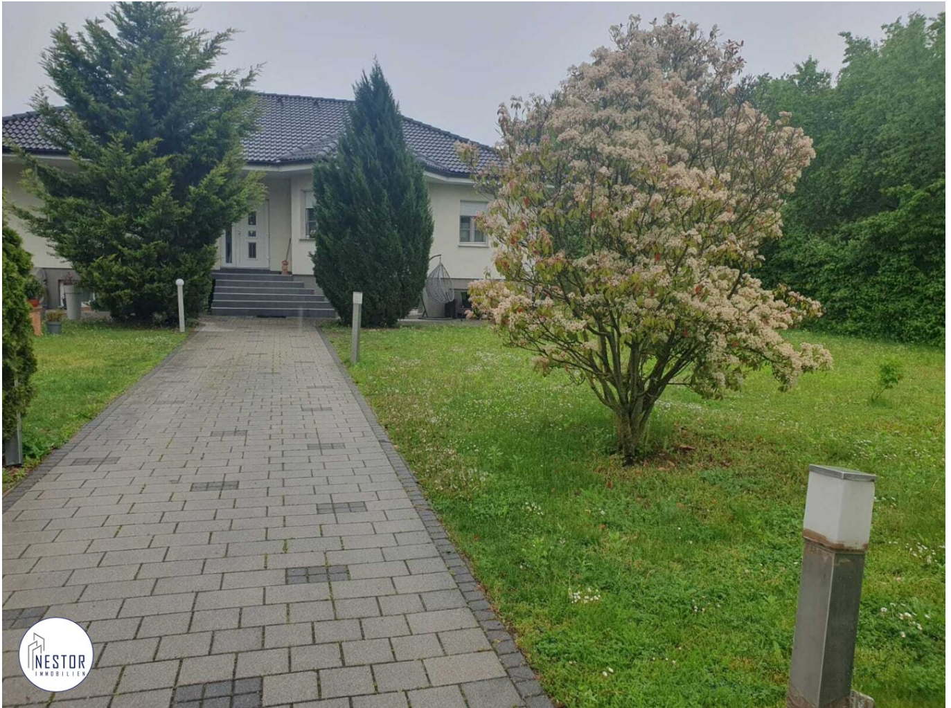
Villa - NESTOR Immobilien