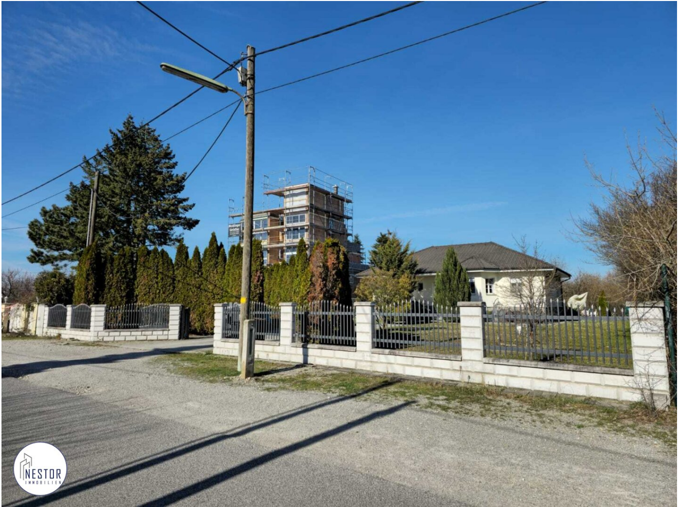
Grundstück - NESTOR Immobilien