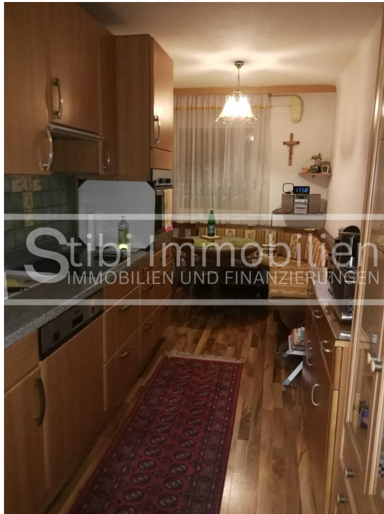
Küche mit Sitzbankgarnitur