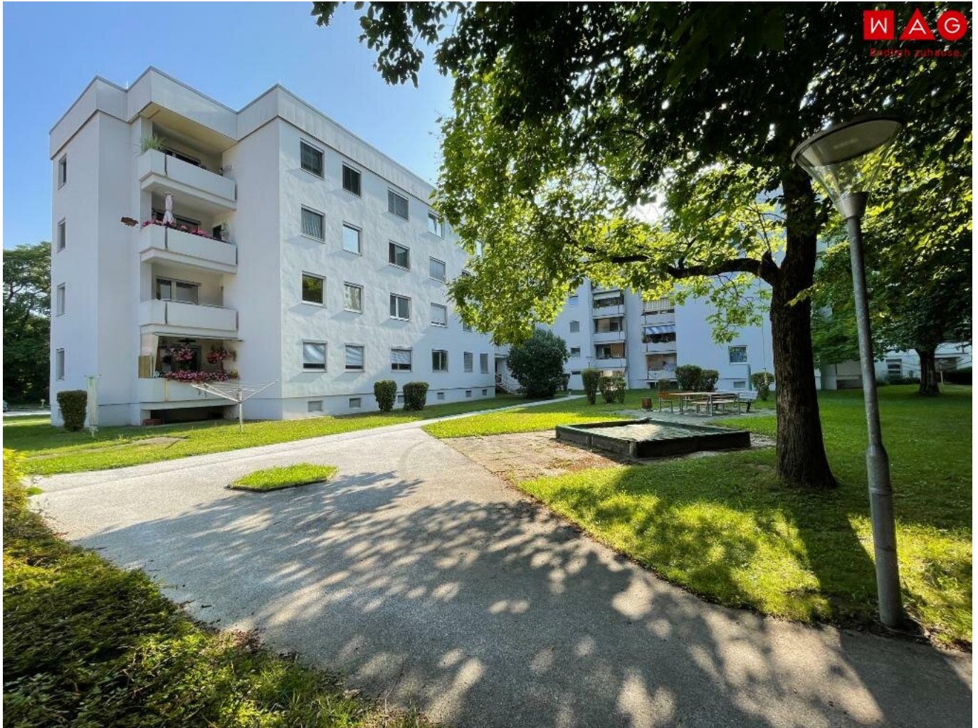
Außenansicht Talwegsiedlung 1