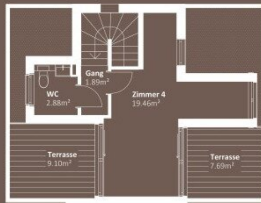
DACHGESCHOSS WNF 24,23m 2