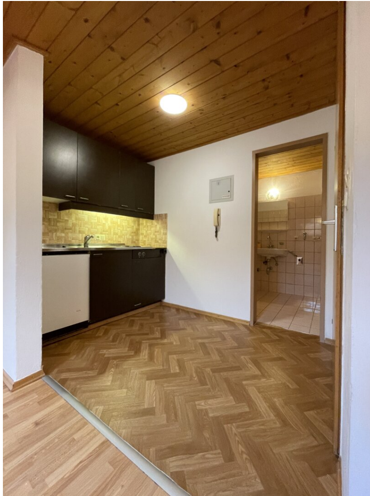
Eingang und Küche