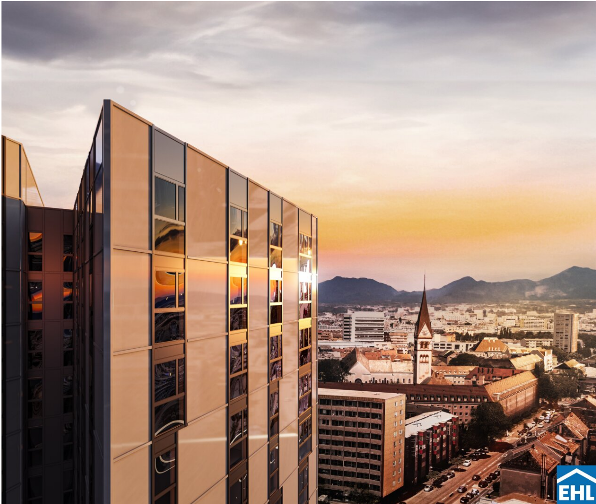
High Five Visualisierung