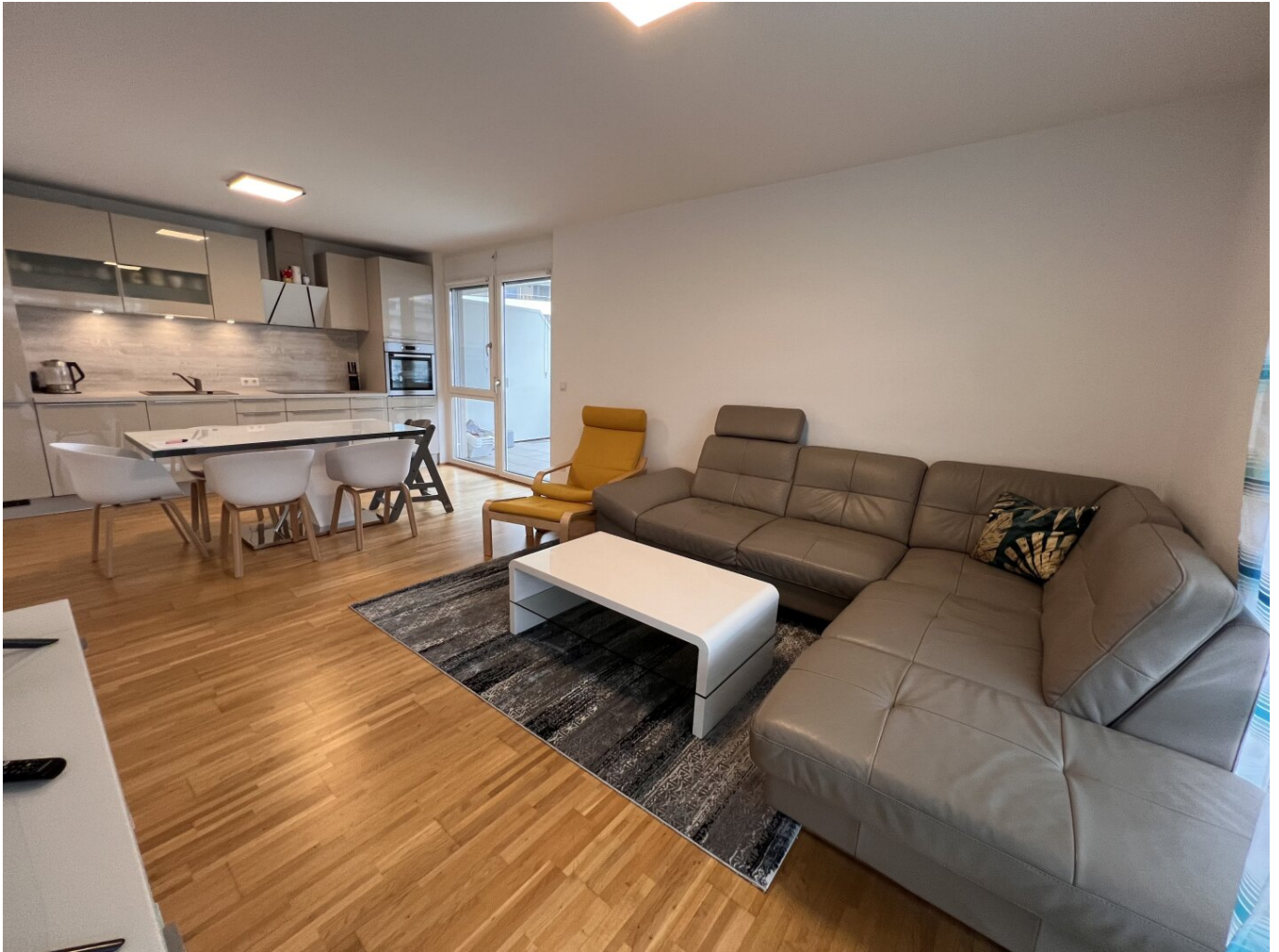
Wohnzimmer mit Küche