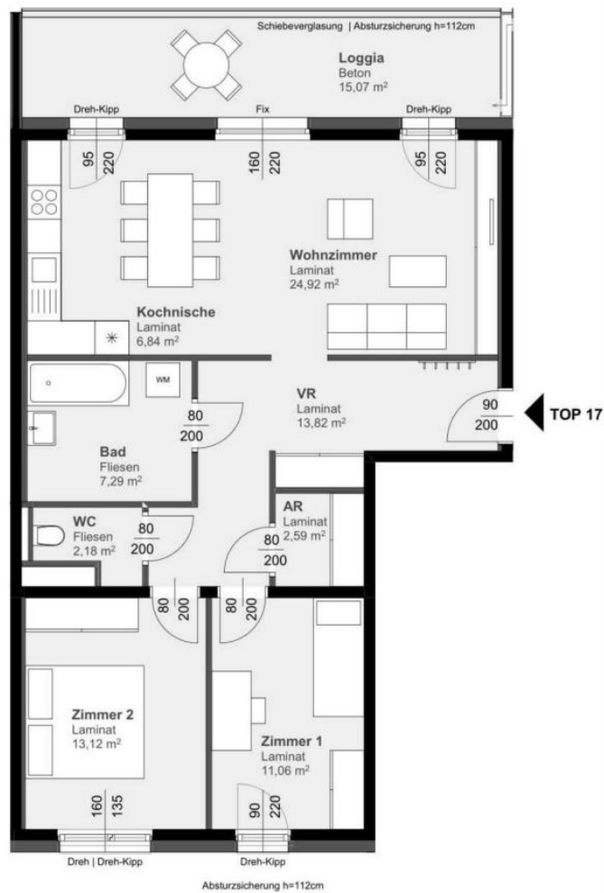
Grundriss Top 17

Objektnummer: 141/82080 Eine Immobilie von Rustler