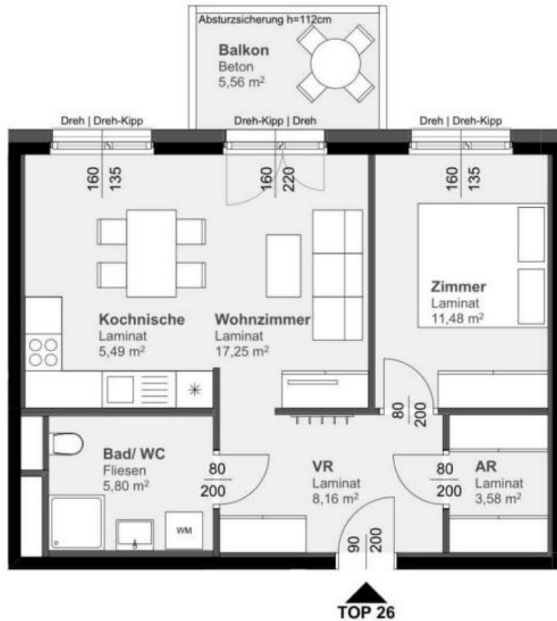
Grundriss Top 26