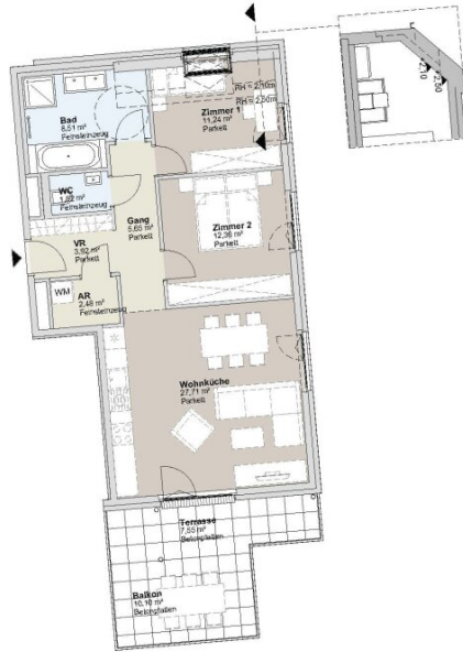
1. DACHGESCHOSS GARTENBAUKÖRPER