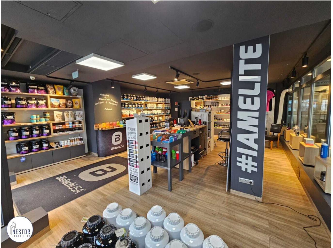
Geschäftslokal - NESTOR Immobilien