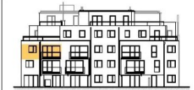
ANSICHT STIEGE 5

WOHNNUTZFLÄCHE 52,59 m 2 BALKON 5,50 m 2