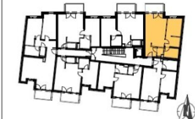
GRUNDRISS STIEGE 5: 2.OBERGESCHOSS