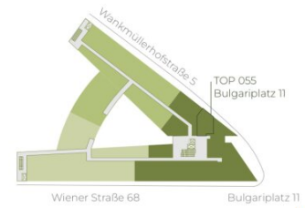
Wiener Straße 68

Die in der Plandarstellung dargestellte Möblierung ist schematisch und dient ausschließlich zur Illustration. Diese Darstellungen sind unverbindliche Plankopien. Der Planung und Ausführung sind Änderungen vorbehalten. Sämtliche Maße sind Rohbaumaße.