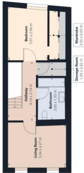
Floor 1 Building 1