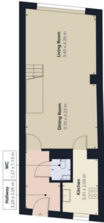
Ground Floor Building 1