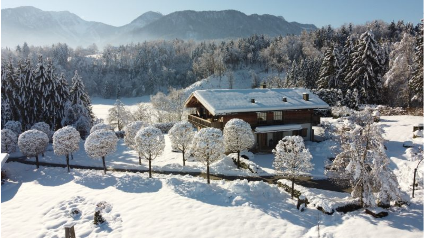
Villa Velden Chalet

Objektnummer: 905/03444 Eine Immobilie von ATV Immobilien