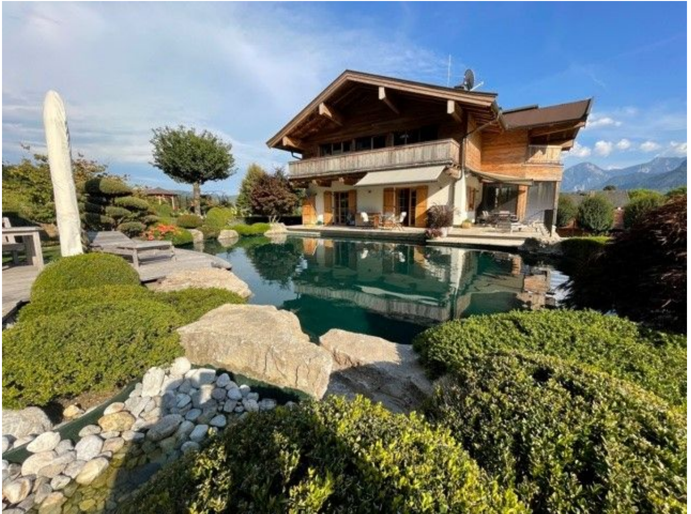
Haus mit Pool

Objektnummer: 905/03444 Eine Immobilie von ATV Immobilien