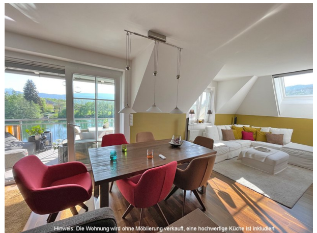
Hinweis: Die Wohnung wird ohne Möblierung verkauft, eine hochwertige Küche ist inkludiert