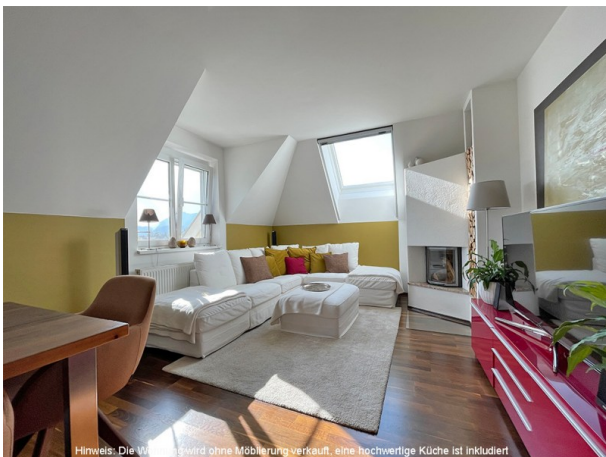
Hinweis: Die Wohnung wird ohne Möblierung verkauft, eine hochwertige Küche ist inkludiert