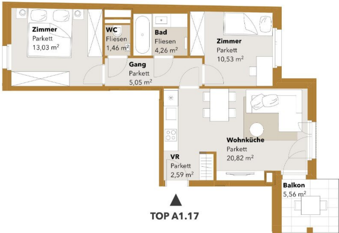
▲ TOP A1.17