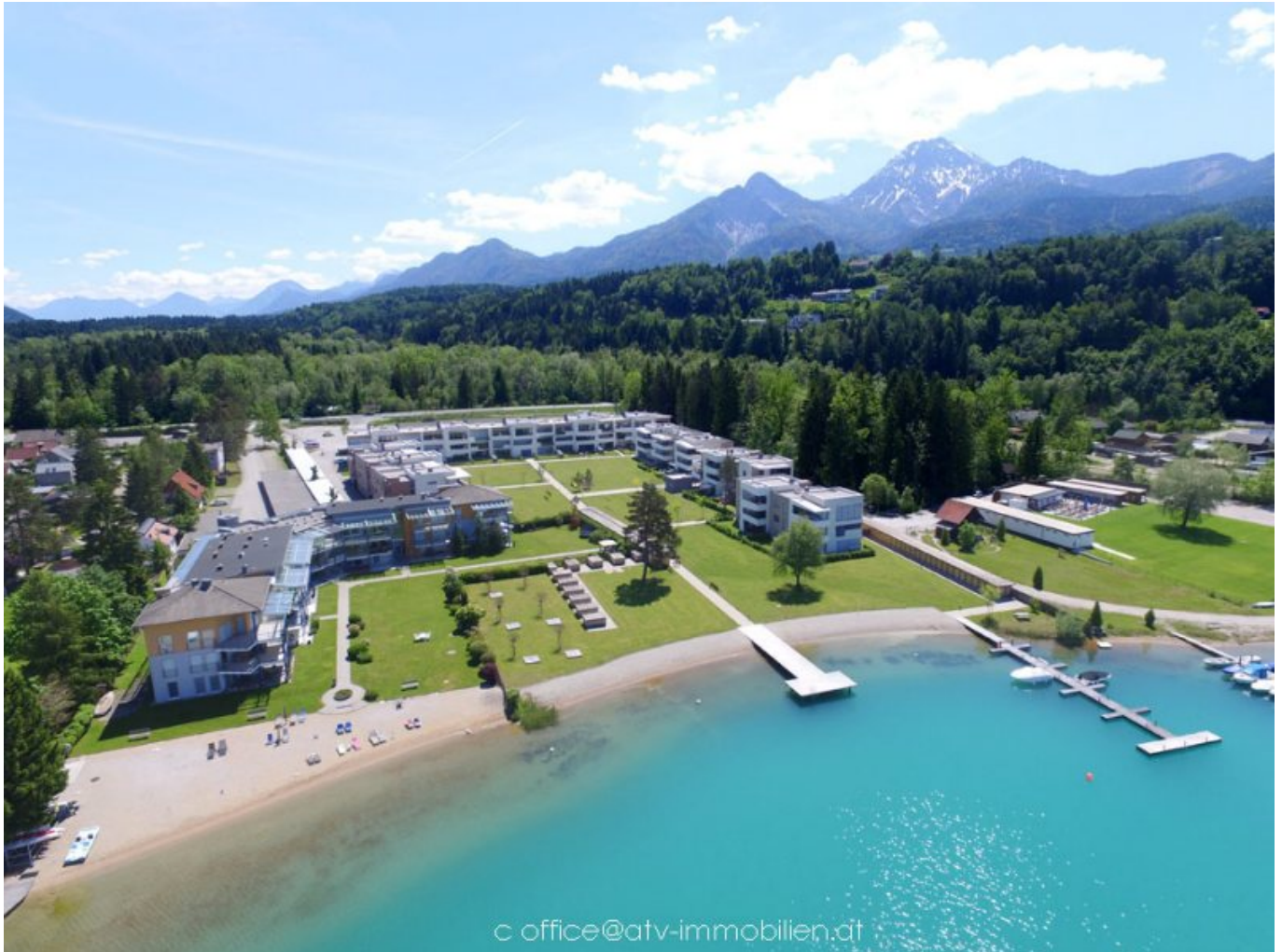
Seewohnung Faaker See