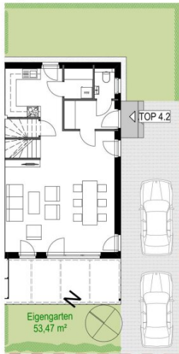
Erdgeschoss TOP 4.2