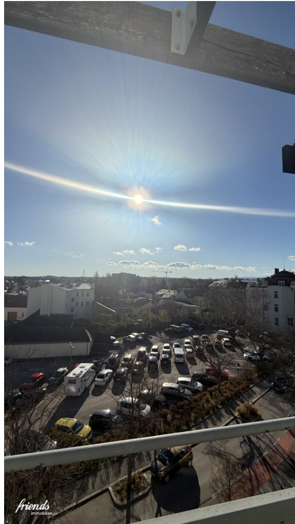
Aussicht kleiner Balkon