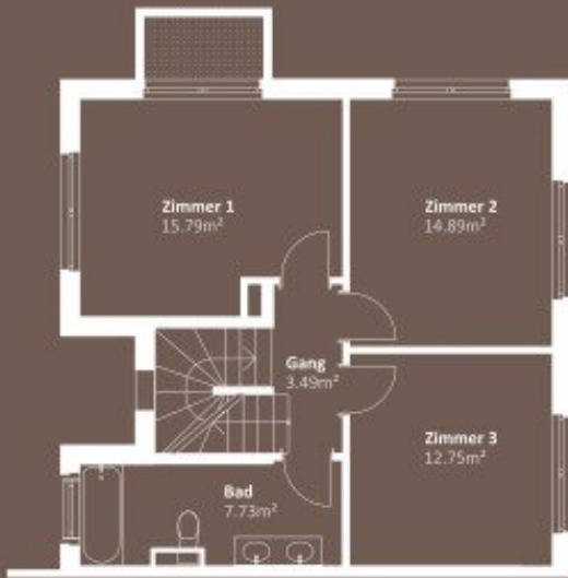
OBERGESCHOSS WNF 54,65m 2