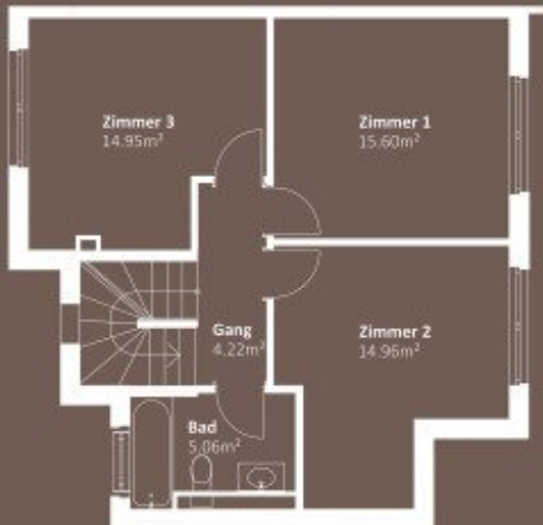
OBERGESCHOSS WNF 54,79m 2