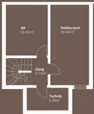
KELLERGESCHOSS WNF 45,77m 2