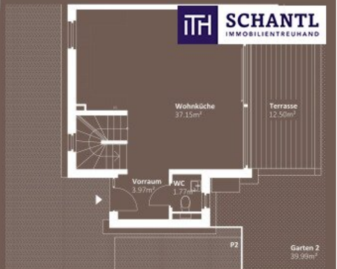
ERDGESCHOSS WNF 42,89m 2