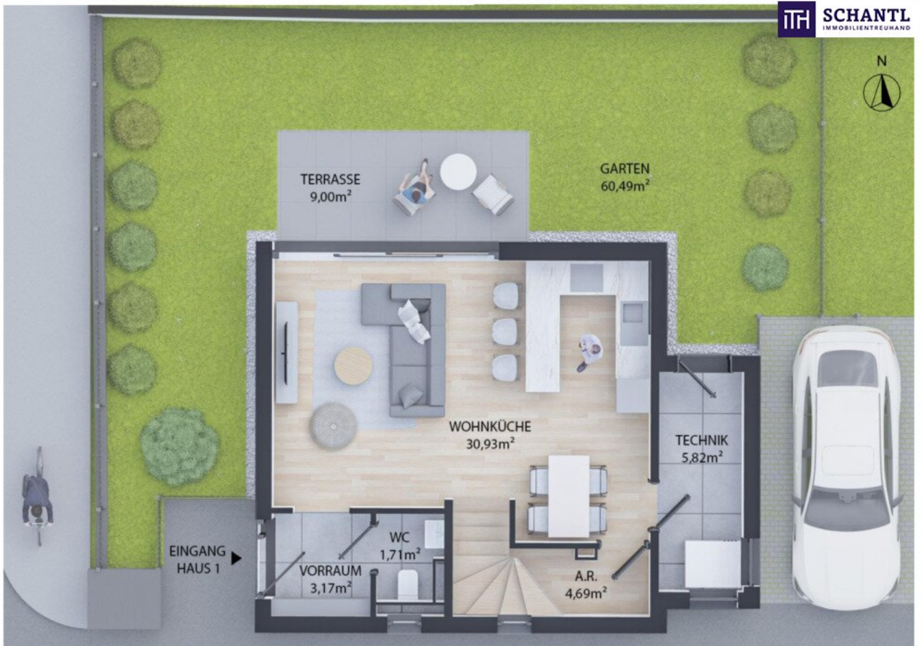
ERDGESCHOSS WNFL 46,32m 2