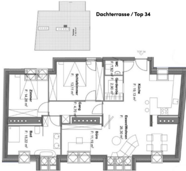
Dachterrasse / Top 34