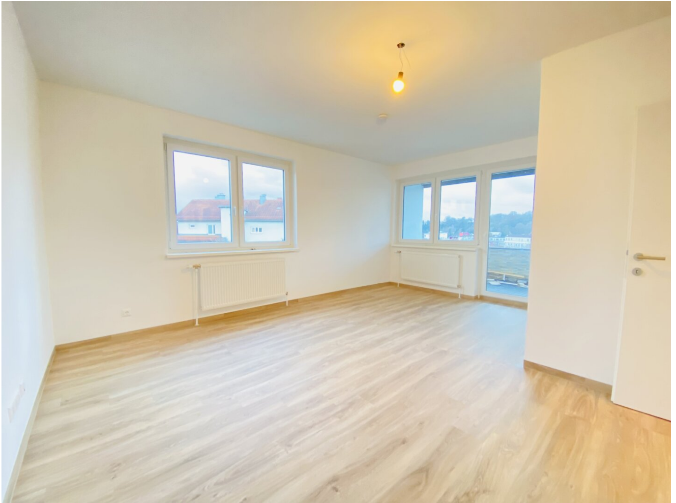
Wohnzimmer mit Loggiazugang